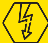
Uitval stroom, gas, water of telefoon