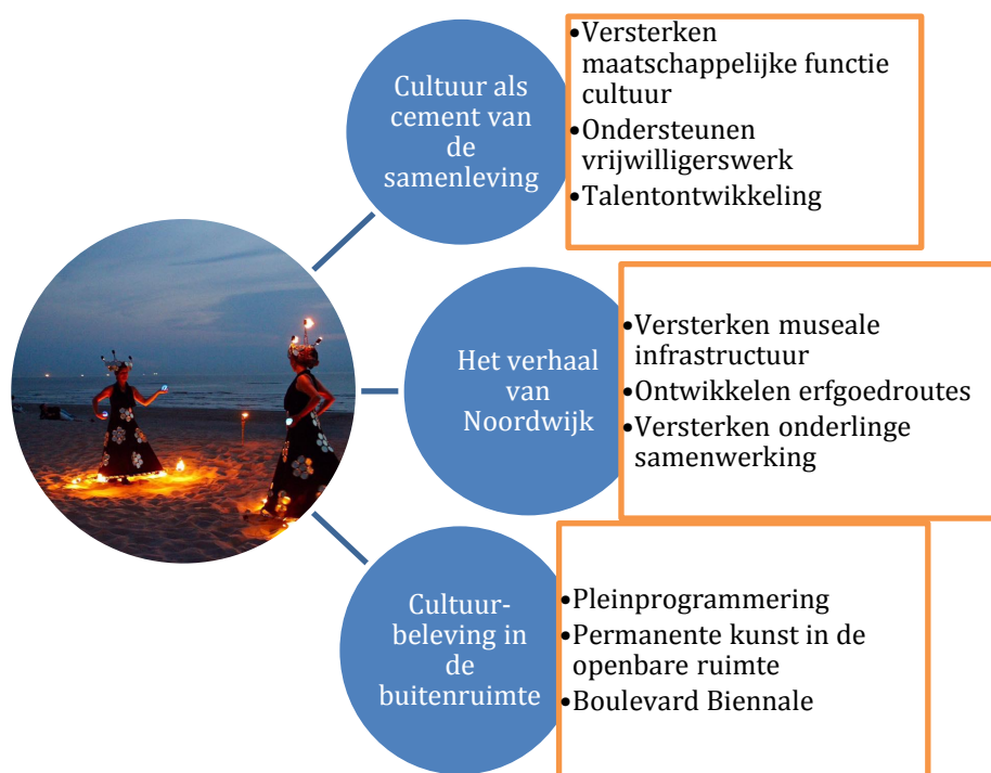
Figuur 1: Inhoudelijke beleidsagenda

Vanuit het culturele veld wordt nadrukkelijk gevraagd om meer samenhang en samenwerking in het culturele bestel van Noordwijk. De algemene opvatting is dat we veel kansen laten liggen omdat er onvoldoende gestuurd wordt op gezamenlijke belangen. Het culturele veld is versnipperd en iedere organisatie is druk met zijn eigen activiteiten. Vanuit de behoefte aan meer samenhang en samenwerking en geïnspireerd door de Omgevingsvisie komen we op basis van de samenspraak met het veld uit op de volgende uitvoeringsprogramma's waar we de komende jaren met elkaar de schouders onder willen zetten: