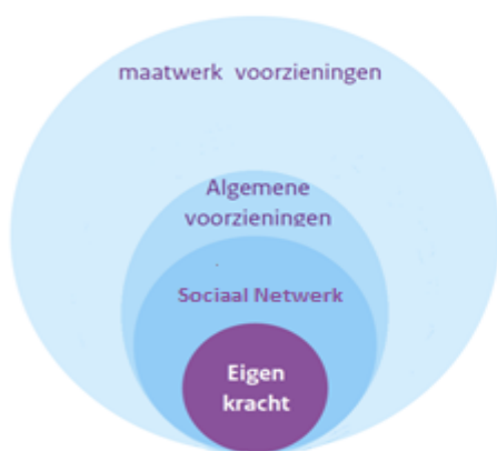
Figuur 1. Korte termijn

ondersteuning in de vorm van een maatwerkvoorziening verstrekt. Dit is een tijdelijke situatie. In de loop der tijd zal en moet er een verschuiving plaatsvinden naar algemene voorzieningen (zie figuur 1 en figuur 2). De jaren 2015 en 2016 gebruiken we om te komen tot een meer structurele situatie waarin het aanbod van algemene voorzieningen wordt opgebouwd en uitgebreid. Zo kunnen vormen van individuele begeleiding bijvoorbeeld ook (deels) door een zorgvrijwilliger worden gegeven, kunnen welzijnsorganisaties hun aanbod verbreden, of kunnen bijvoorbeeld sportverenigingen een vorm van dagbesteding bieden.