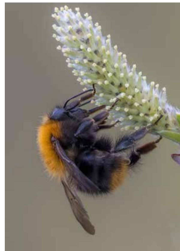
Akkerhommel op wilg. Gertjan van der Kooij. 1e prijs Bijenlandschap fotowedstrijd 2019

Meedoen? Ga dan naar bijenlandschap.nl om de foto's te uploaden. De jury bepaalt uiteindelijk welke 3 foto's een prijs winnen.